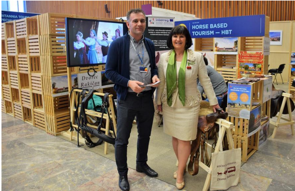
V družbi državne sekretarke ministrstva za gospodarstvo, ga. Eve Štravs Podlogar.