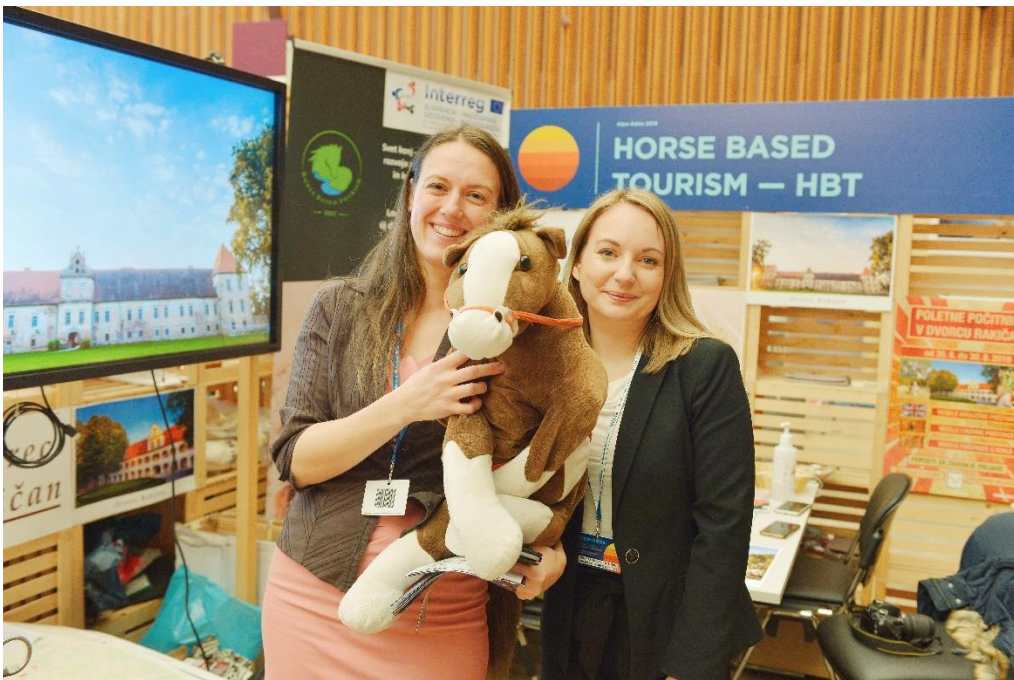
Predstavnici PP2 in vodilnega partnerja.